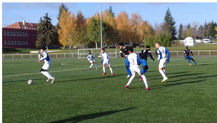
Match championnat Minimes MC Provins/DG Saint-Denis.

La municipalité de Provins met à la disposition de la section sportive un terrain synthétique de qualité (nouvelle structure 2019). Le matériel pédagogique (chasubles, ballons...) est offert par le District 77 de Football .