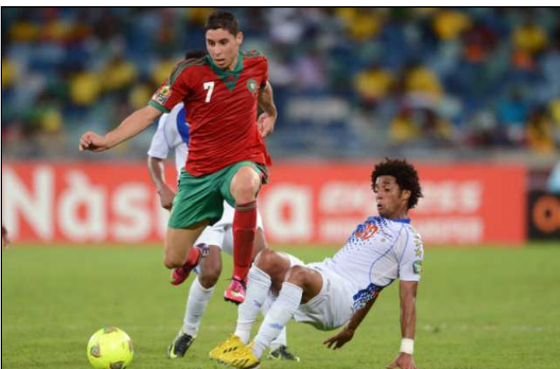
Abdelaziz Barrada, Ancien International Marocain.

Sur mes quatre années de collège, je me suis progressivement construit des bases qui me servent aujourd'hui autant pour la vie de tous les jours que pour le football.