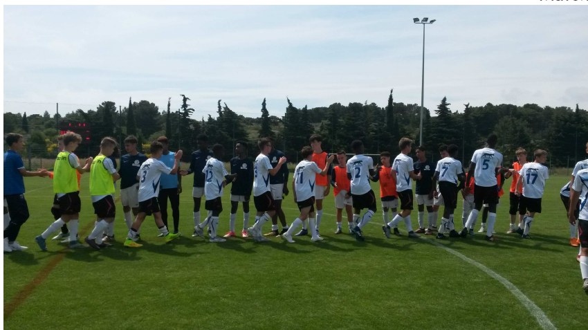
A.J.Auxerre/MC Provins, championnat de France Minimes, Port Barcarès, juin 2018.

La section sportive évolue en championnat régional scolaire avec les sections du 77,94 et 93 (Torcy, Melun, Drancy Montfermeil, B Mesnil...).