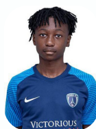
LIONEL AU PARIS FC